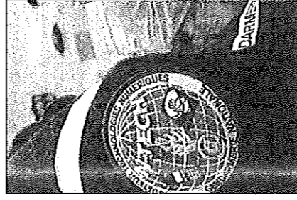
Les gendarmes spécialisés préconisent le cryptage des télécommunications.